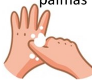
El dedo pulgar