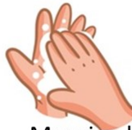
Masajea las palmas