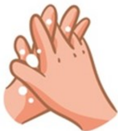
Entre los dedos