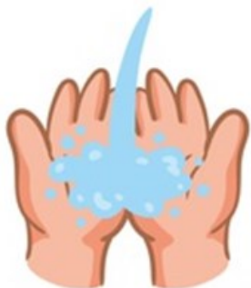
Moja tus manos